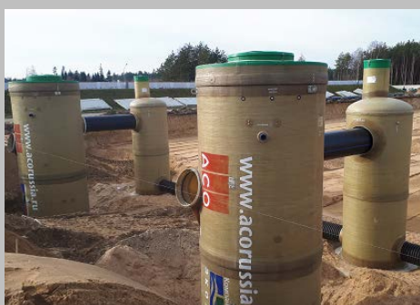
Индустриальный парк "Великий камень" "Оборудование для очистки поверхностного стока в составе ЛОС накопительного типа с самым большим в мире безбетонным аккумулярующим резервуаром АСО StormBrixx, Минск, Республика Беларусь